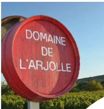
Domaine de l'Arjolle à Pouzolles.