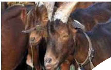
Chèvres du Rove de St Jean de Cornies.