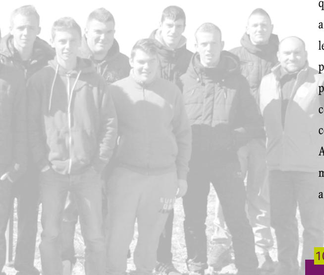
Les terminales du lycée Bonneterre de Pézenas.