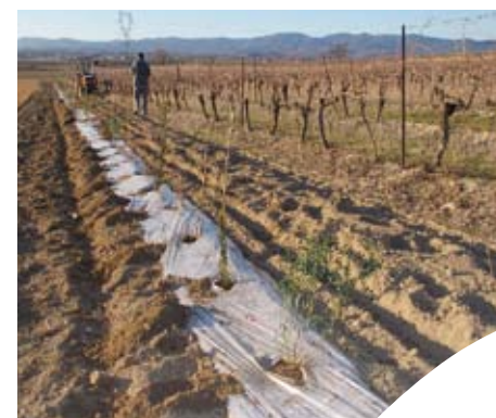
Domaine de l'Horte.

Contact à la Chambre d'agriculture de l'Hérault Permanence le lundi à Montblanc Clélia Saubion au 04 67 36 47 18 ou 06 18 36 83 07 saubion@herault.chambagri.fr