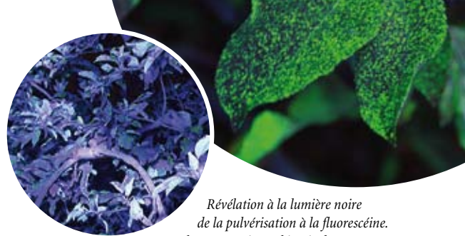
Révélation à la lumière noire de la pulvérisation à la fluorescéine.