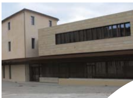
Antenne de Lodève.

Contact à la Chambre d'agriculture de l'Hérault Pôle Agroenvironnement et Territoire au 04 67 20 88 55