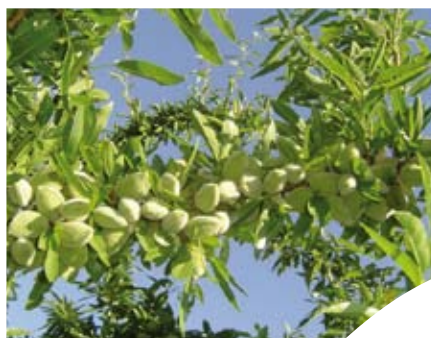
Branche d'amandier.

Contact à la Chambre d'agriculture de l'Hérault Cyril Sévely au 04 67 20 88 41 sevely@herault.chambagri.fr